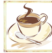
Café / Imbiss